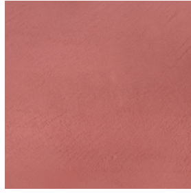
BM2040 AMARA INTENSE