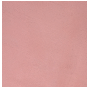
BM2042 AMARA MID