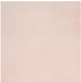
BM2038 NUDE MID