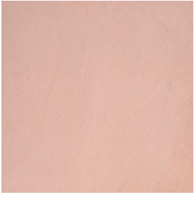
BM2036 NUDE INTENSE