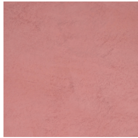
BM2041 AMARA STRONG