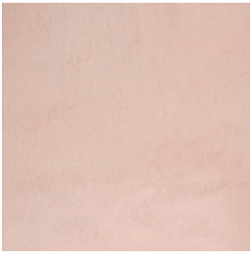
BM2037 NUDE STRONG