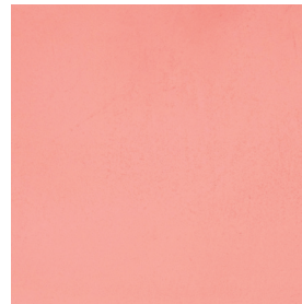
BM2046 CORAL MID