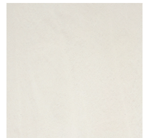
BM2051 OAT LIGHT