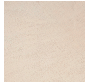
BM2049 OAT STRONG