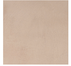
BM2048 OAT INTENSE