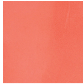
BM2045 CORAL STRONG