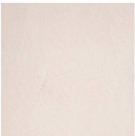
BM2039 NUDE LIGHT