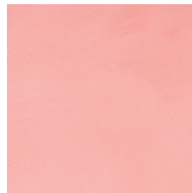
BM2047 CORAL LIGHT